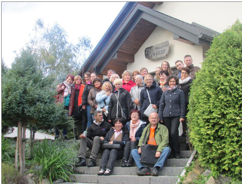
Fot. 1. Doradcy MODR uczestniczący w szkoleniu, wyjazd studyjny – Zaczarowane Wzgórze w Czaławiu

W szkoleniu udział wzięło 30 doradców MODR. W tej grupie zdecydowana większość, tj. 70% posiadała ponad 5 letnie doświadczenie w pracy doradczej związanej z tematyką szkolenia. Uczestnicy wysoko ocenili zakres przedmiotowy, sposób prowadzenia zajęć, organizację i przydatność szkolenia (śr. powyżej 85% najwyższych ocen we wszystkich kategoriach).