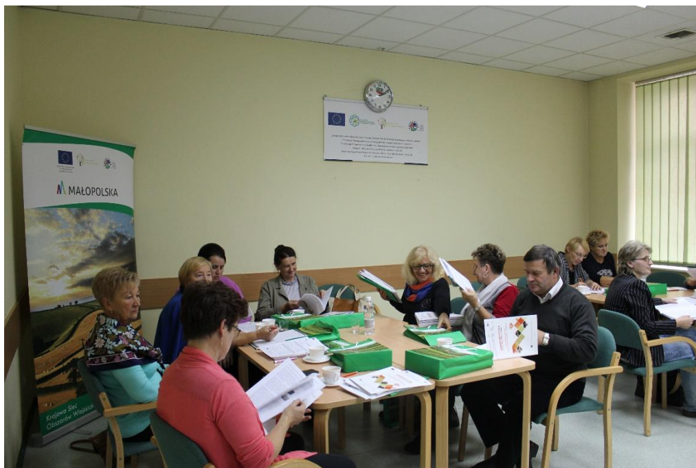
Fot. 3. Szkolenie dla kwaterodawców