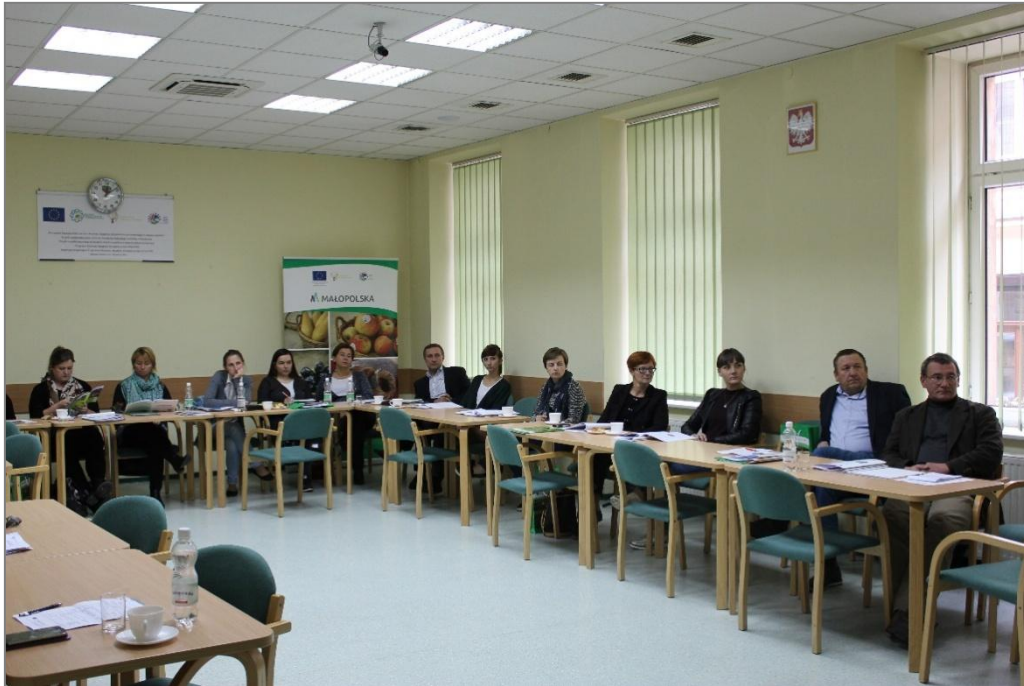
Fot. 2. Szkolenie dla pracowników jednostek samorządu terytorialnego

W szkoleniu udział wzięło 30 przedstawicieli urzędów gmin i pracowników lokalnych grup działania z Małopolski. Większość uczestników (55%) posiadała stosunkowo krótki, poniżej 5 lat staż pracy w dziedzinie turystyki wiejskiej. W ankietach ewaluacyjnych uczestnicy wskazali na konieczność zmniejszenia liczby zajęć teoretycznych na rzecz praktyki oraz poszerzenia zakresu zagadnień prawnych kosztem marketingu terytorialnego.